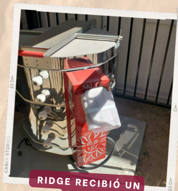
RIDGE RECIBIÓ UN NUEVO HORNO DE CERÁMICA