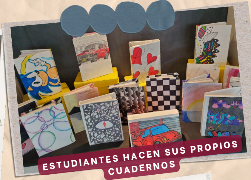
ESTUDIANTES HACEN SUS PROPIOS CUADERNOS