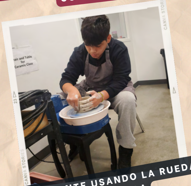
ESTUDIANTE USANDO LA RUEDA DE CERAMICA